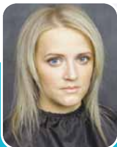
фото 1: Наращивание пробора занимает несколько минут. Для этого используйте специальный съемный стик подготовленный к наращиванию.

фото 2: Прикрепите накладку на выбранный желаемый пробор.