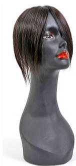
T-PARTING N Normal 20 cm