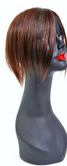
T-PARTING XL XL 20 cm