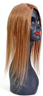
T-PARTING XL Long XL 40 cm